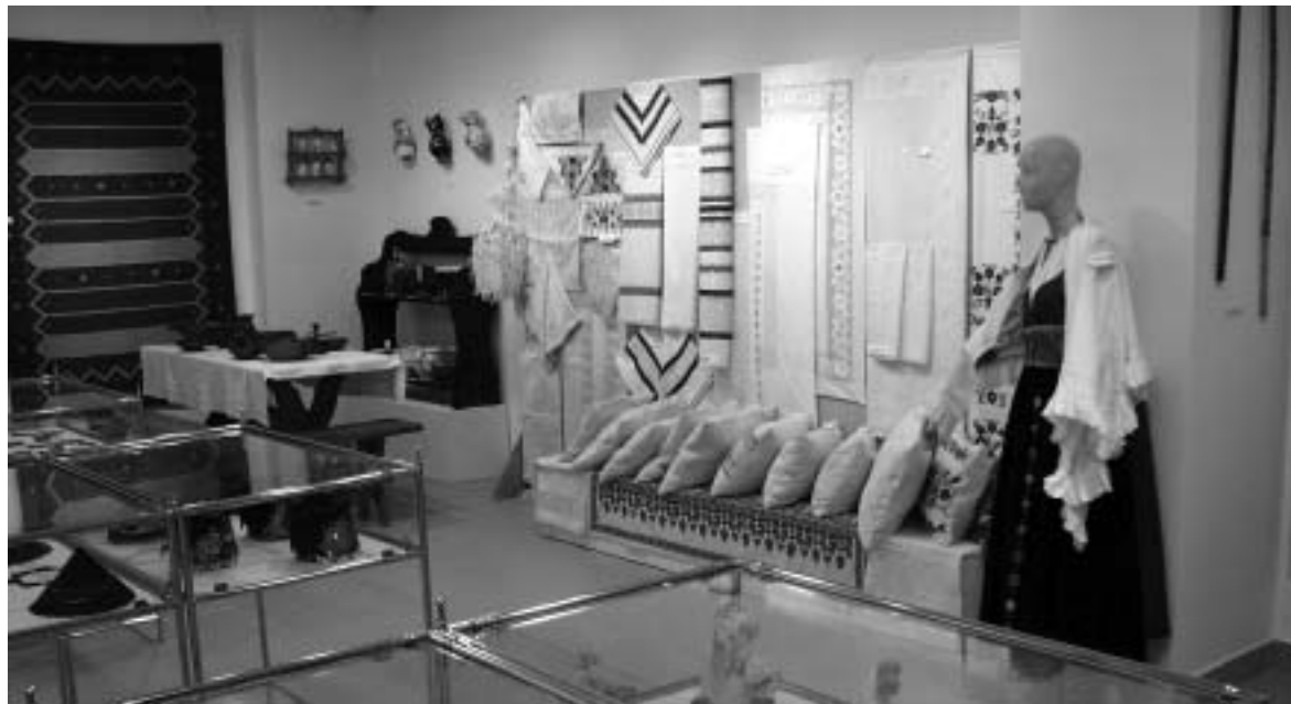
Részlet a Zala Megyei Népművészeti Egyesület Kiállításáról

Nekünk itt e hatalmas örökség, kincsestár, él-