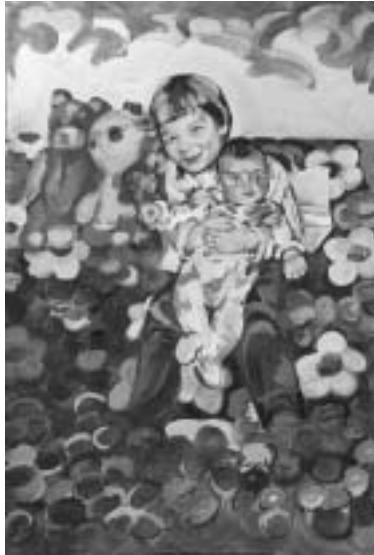
Nyár III., olaj, vászon

hogy egészen más technikával készültek. A figurális elemek festve vannak, tehát nevezhetők ábrázolatoknak. Ezek a falfelületek viszont szinte azonos technikával készülnek, mint a valódi falak. A festő homokot kever ragasztóanyaggal és így rögzíti a kartonhoz, vászonhoz, azután színezi őket, amíg a kívánt hatást el nem éri. Vagyis nem ábrázolja a falakat, hanem imitálja, megjeleníti. De hát mit is keresnek a falak egy - rendeltetése szerint - festménynek készült objektumon? Kép és fal kezdettől