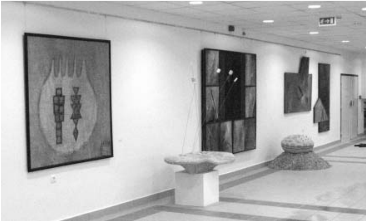
Enteriőr a Gönczi ÁMK megújult killítóterében

Soha nem felejtem el például azokat az estéket, melyeknek főszereplője egy erdélyi magyar szobrász volt, aki magával hozta a "bútorát" is. Így nevezte ugyanis a hegedűjét, mellyel néha hajnalba nyúlóan "bútoroztuk be" a Kéz- művesek Házát. A hegedűszóra pedig együtt énekelt a marosvásárhelyi, a zalaegerszegi és a budapesti magyar, de még a kiváló román fes-